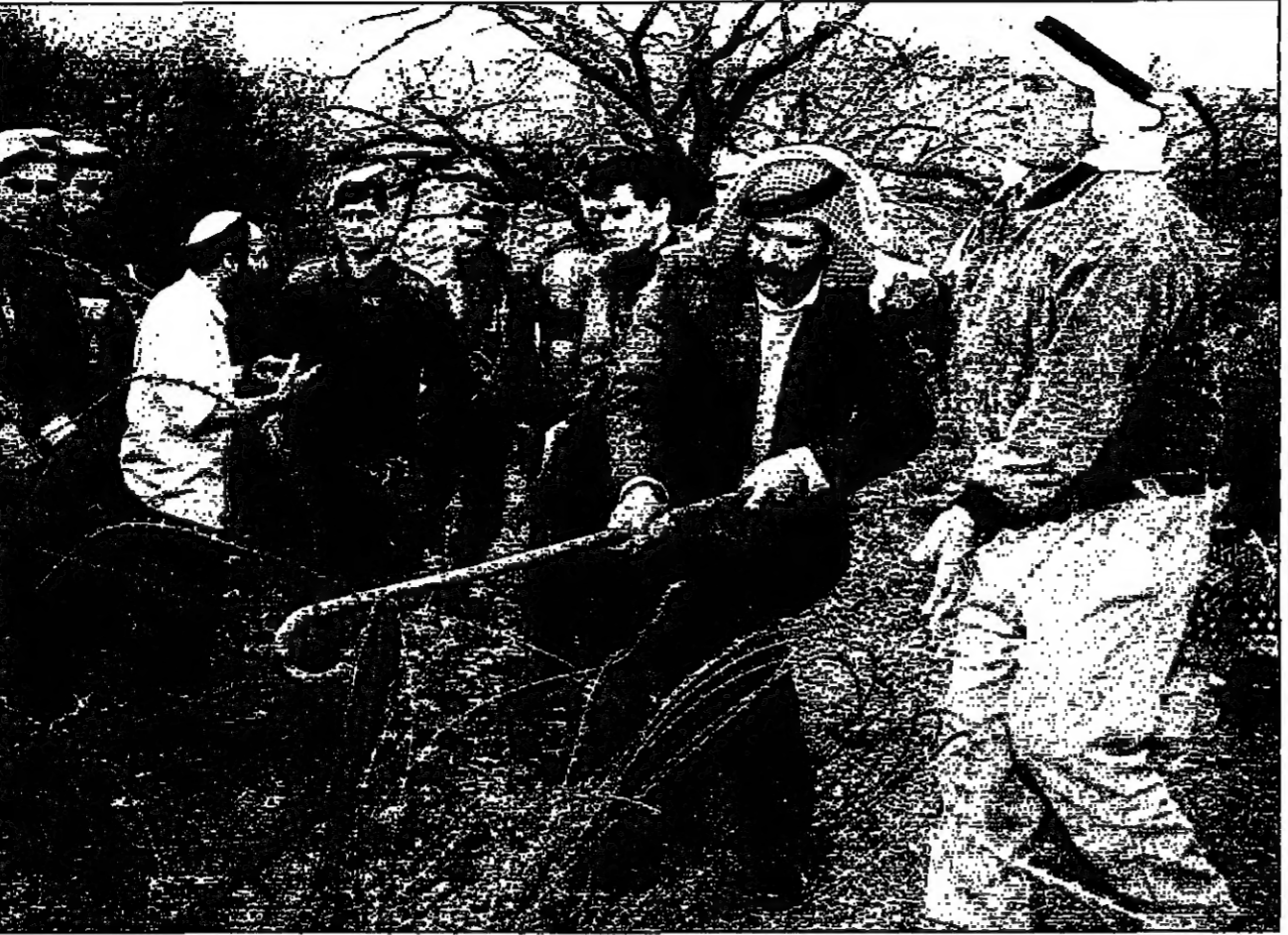
فلسطيني يذبح أمس سلكا شاككا وضعة المستوطنون حول مستوطنة كريات أربع في منطقة الخليل وضواها بواسطة زمرة فلسطينيين استوطنتهم

للسوطون في الأراضي الفلسطينية التي التزم الهدوء والتخلي عن زعمهم على التخلي عن حالات التوصل الى اتفاق بشأن الخليل.